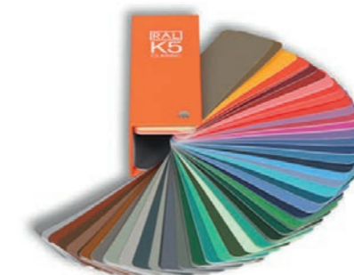
Coloris RAL au choix sans supplément